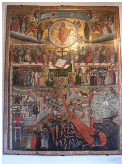
Musée historique de Sanok : les icones