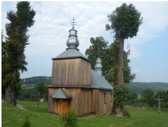
Dans les Carpates : Eglises orientales de la vallée du San