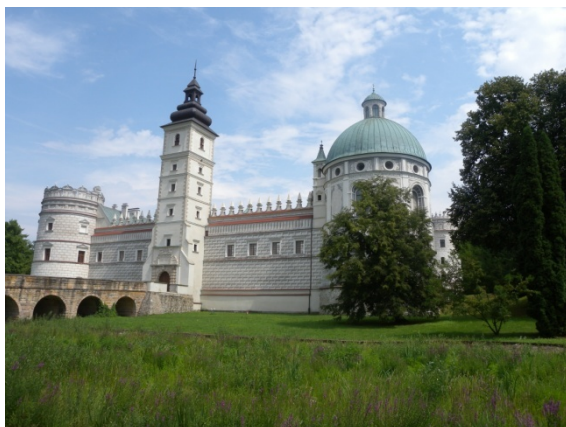
Le château de Krasiczyn