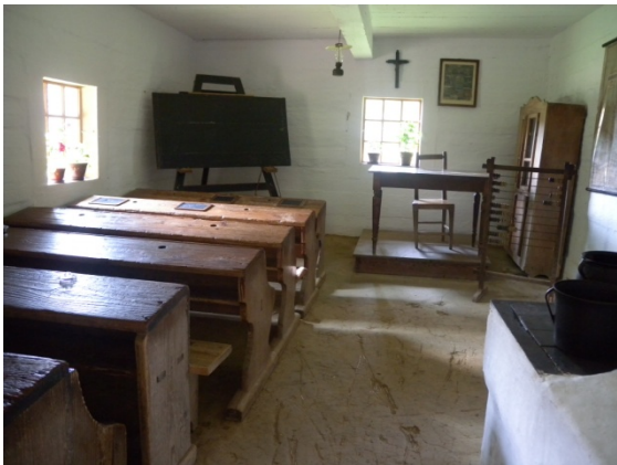
Musée d'architecture populaire