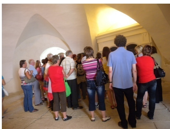
Visite guidée en polonais !