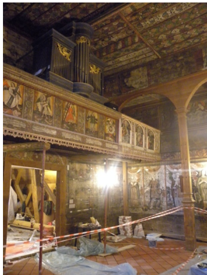
Eglise de Binarowa