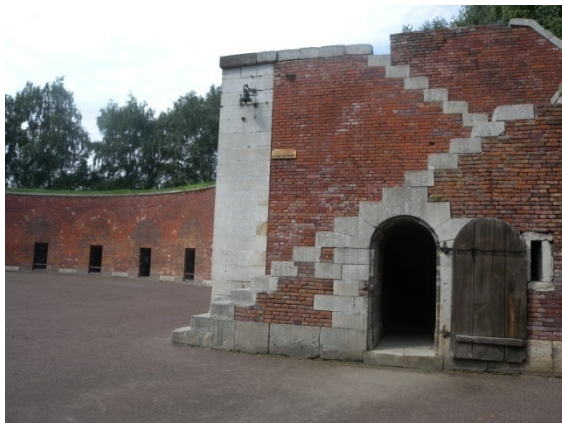
La Rotonde : 8000 exécutés