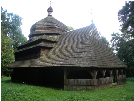
Après avoir fait 2 fois l'ascension afin de pouvoir voir l'intérieur : l'église de Ulucz