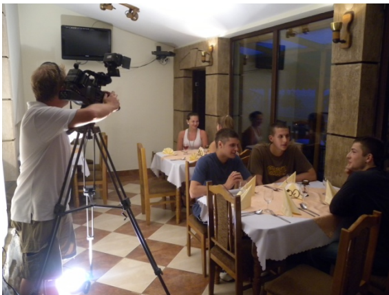
Tournage d'une émission de télé sur l'art culinaire