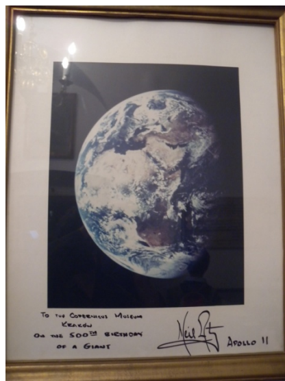
Hommage de Neil Armstrong à Copernic