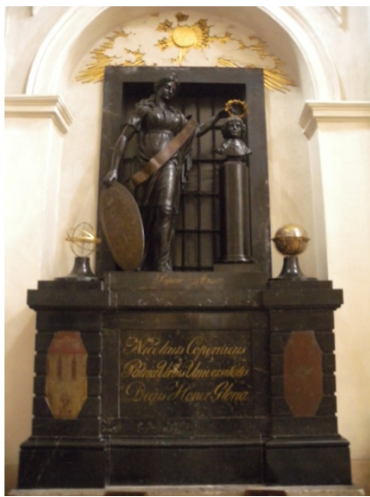
hommage à Copernic