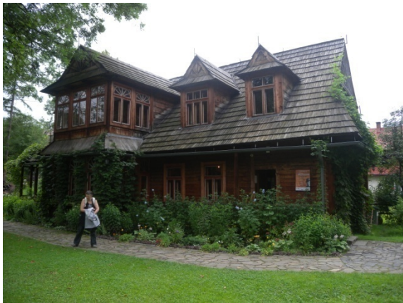
Maison Atma de Karol Szymanowski