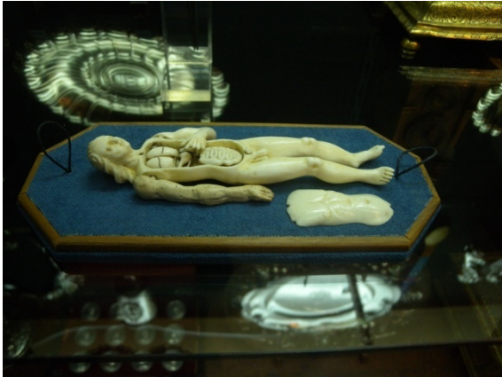
Pour les leçons d'anatomie