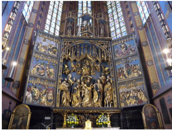
Le retable de Veit Stoss