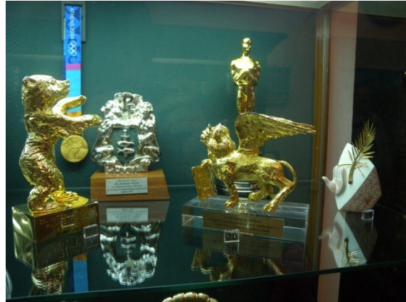
Divers prix donnés à Andrzej Wajda