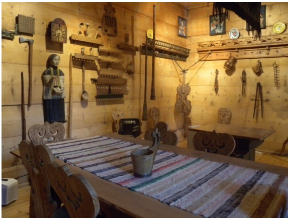
musée Stanislas Witkiewicz