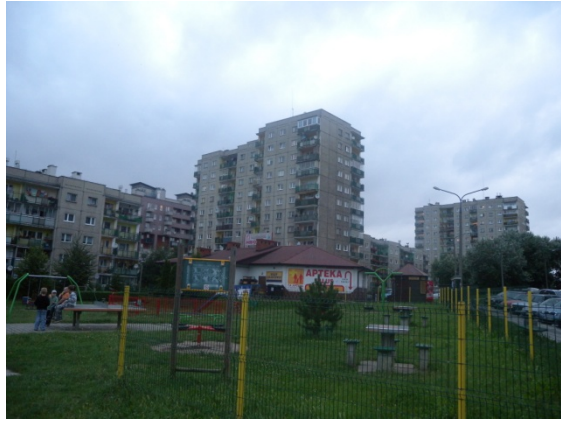
Vers Nowa Huta