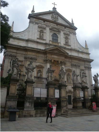
Eglise St-Pierre et St-Paul