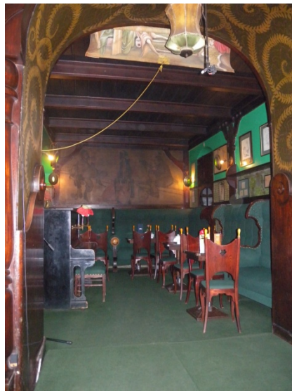
Le très beau café de Cracovie : L'antre de Michalik