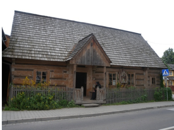
Les maisons de Chocholow