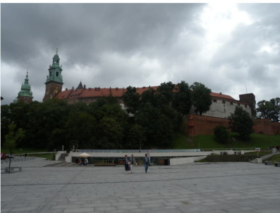
La colline de Wawel