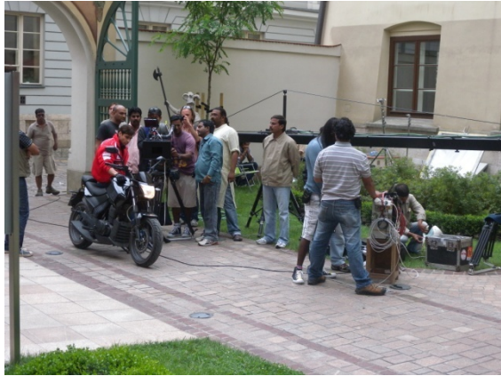
C'est Bollywood à Cracovie !