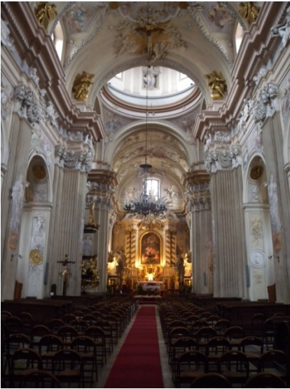
Eglise Ste Anne