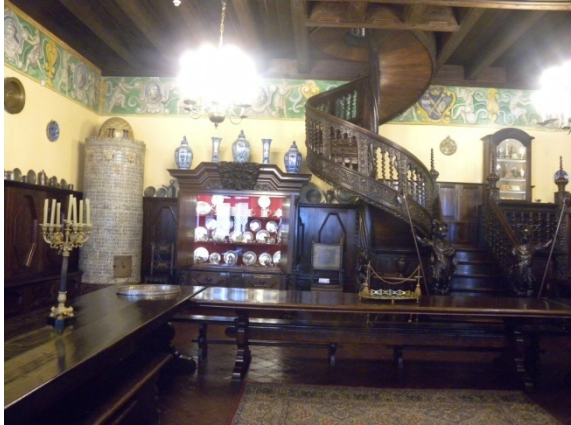
Le collegium Maius