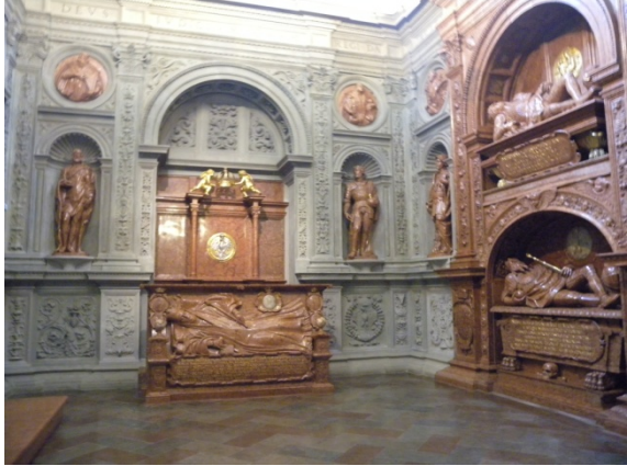
La cathédrale de Wawel où les polonais enterraient leurs rois