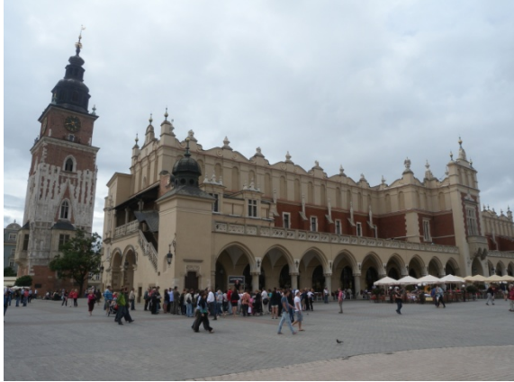
Autour du Rynek