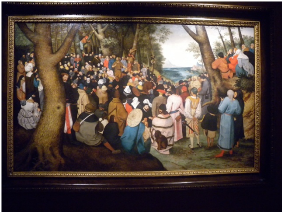
Bruegel : Saint-Jean baptiste prêchant