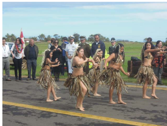
Réception pour un Ministre