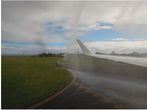
La piste de secours pour la navette