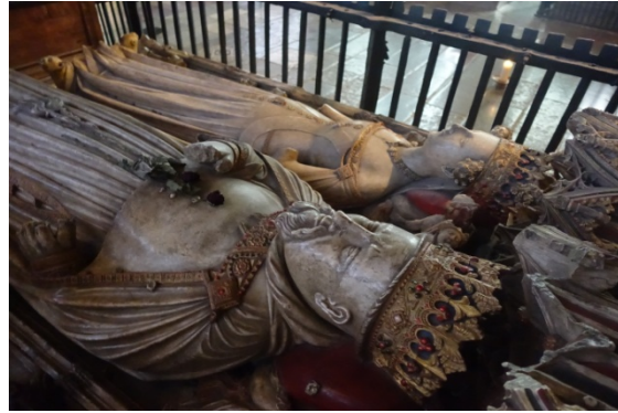
Henri IV et Jeanne de Navarre