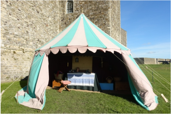
Château de Douvres