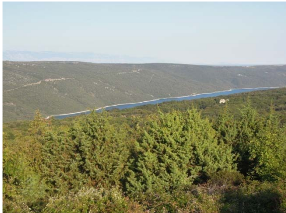
Lac Vransko, le plus profond de Croatie : 74 m !