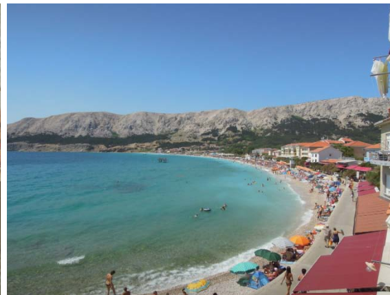
Baska, l'une des plus longue plage de Croatie