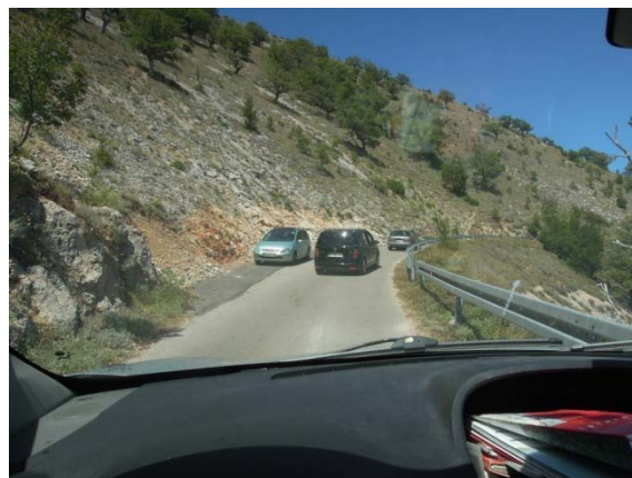
Ile de Cres