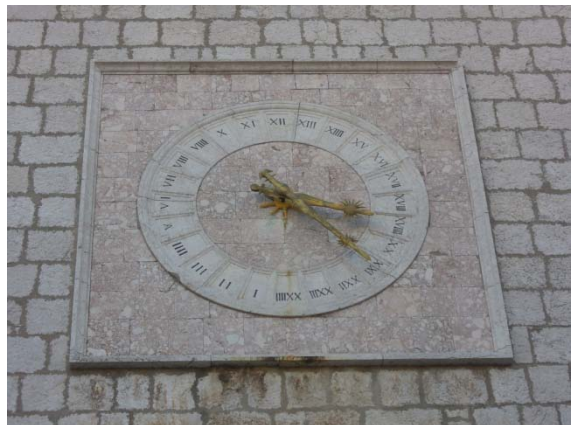
Horloge graduée de 24 heures