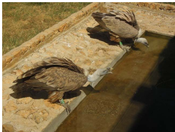
Le centre de protection des vautours