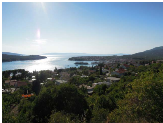
La plage de notre hôtel à Cres