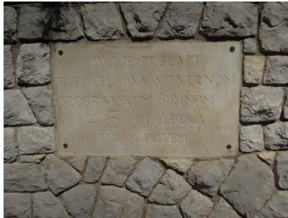
On est la latitude de Bordeaux