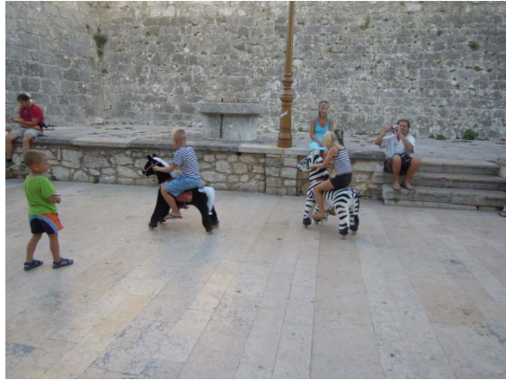
Chevaux à ressorts...