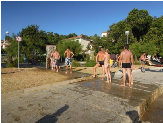
pour se changer, mieux qu'une grande serviette !