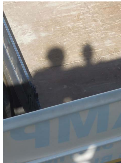
Nos ombres !