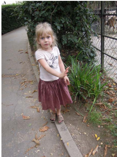
Jardin des plantes