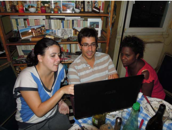
En famille à Paris fin aout 13