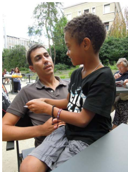
Ron Mueck à la Fondation Cartier