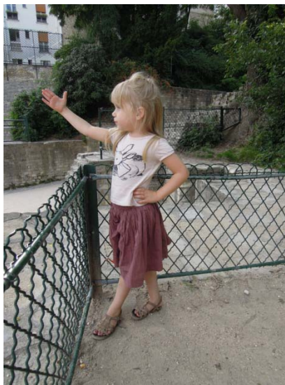
Les arènes de Lutèce