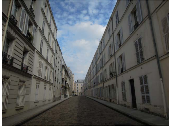
Rue de l'enfer