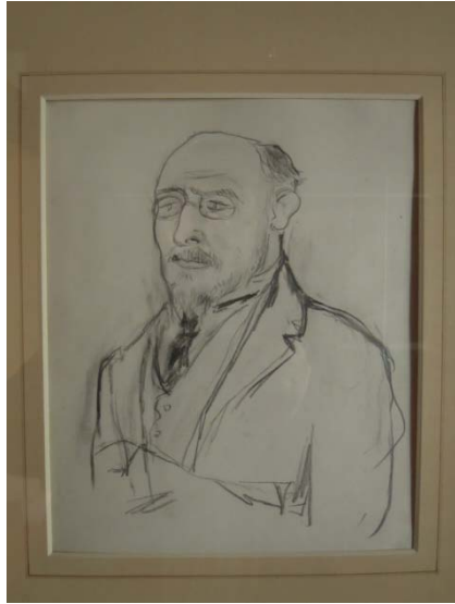
Le manège musical d'Erik Satie