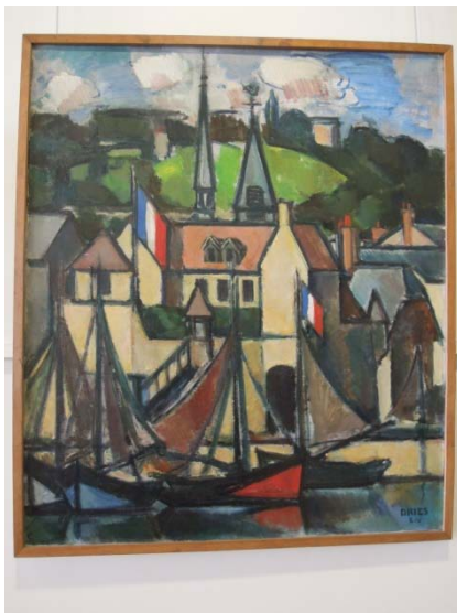
Musée Eugène Boudin : Dries