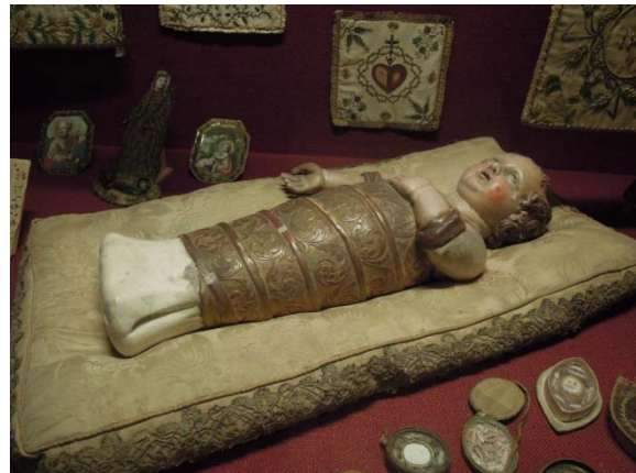
Musée Eugène Boudin