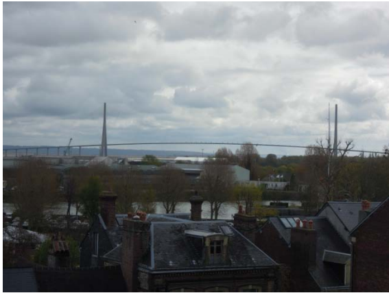
Pont de Normandie