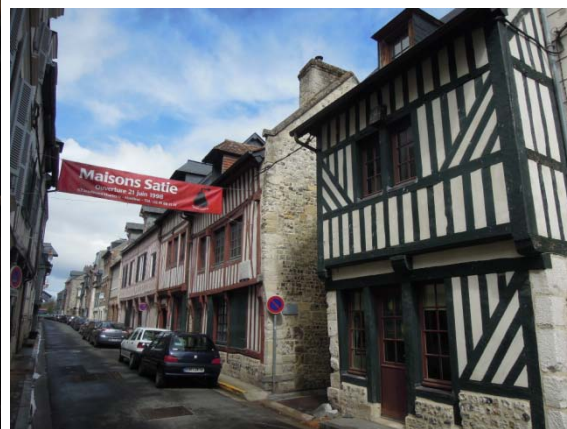
Les maisons Satie