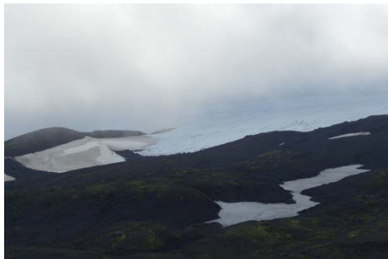
Montée au Mont Snaefelljokull