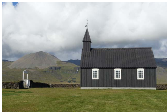
Eglise de Budir, une des plus vieille église en bois d'islande