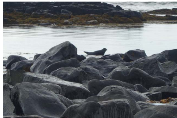
Ytri Tunga : les phoques