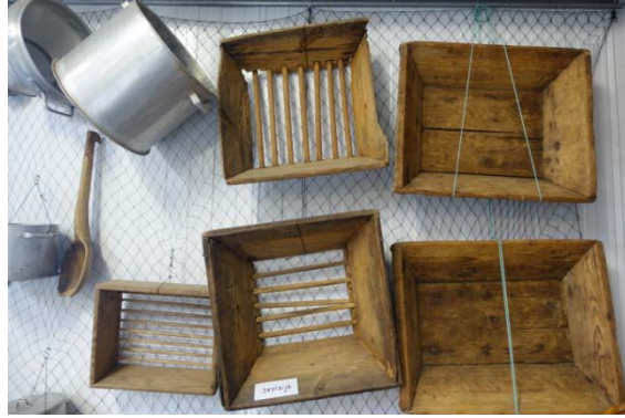
Bjarnarhofn : la ferme aux requins