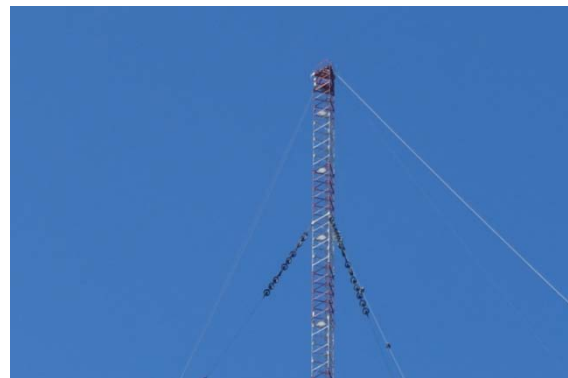
Cette antenne mesurerait 412 m et serait ainsi la plus haute structure d'Europe