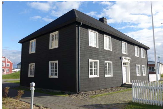
La maison norvégienne