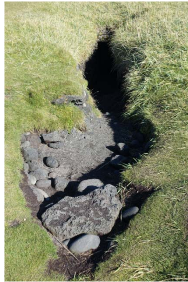
Source de Falki