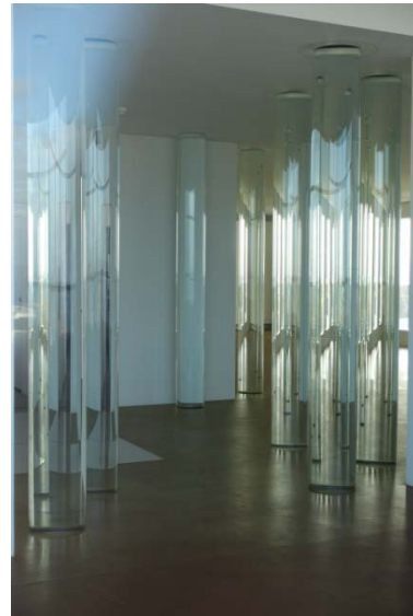
La bibliothèque de l'eau : œuvre de Roni Horn