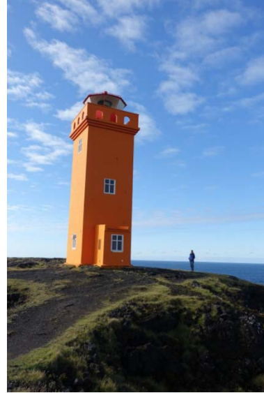
Falaises de Svortuloft