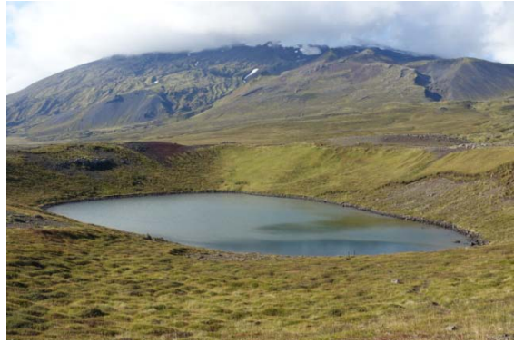
Cratère du Bardarlaug