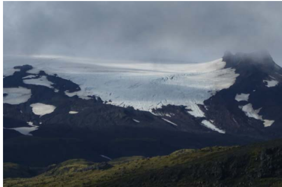
Le Mont Snaefellsjokull