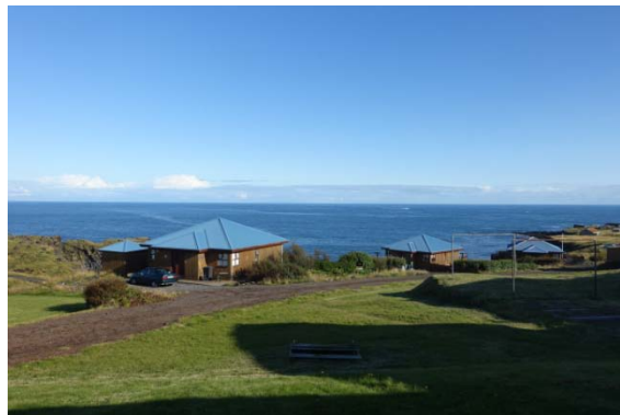
Notre hôtel à Hellnar