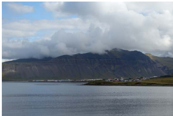
Le mont Kirkjufell