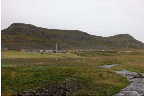
Une casse de voitures