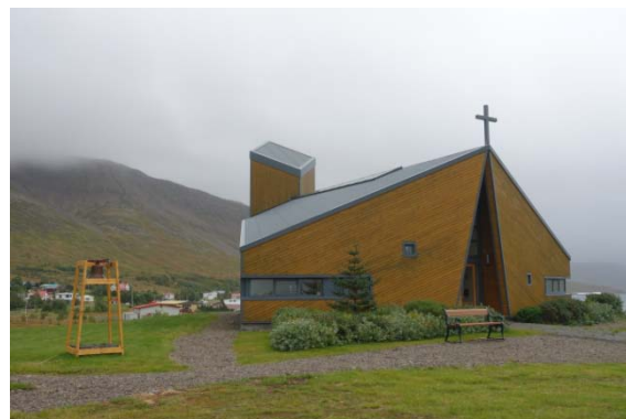
Eglise de Talknafjordur