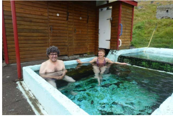
Source chaude de Pollurinn