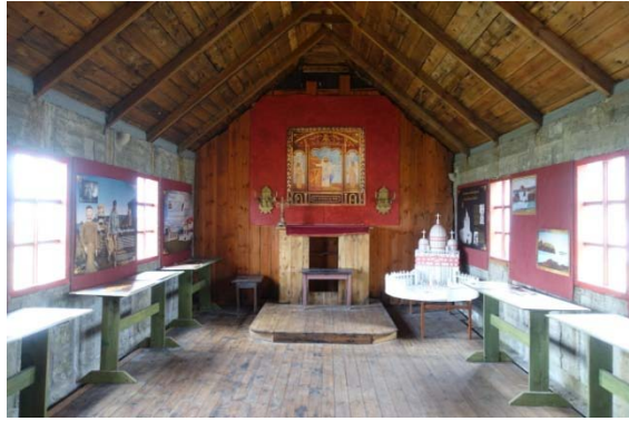
L'église, la maison et les sculptures de Samuel Jonsson