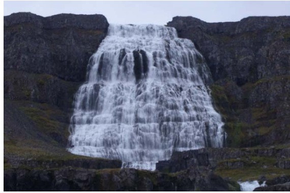
La cascade de Dynjandi