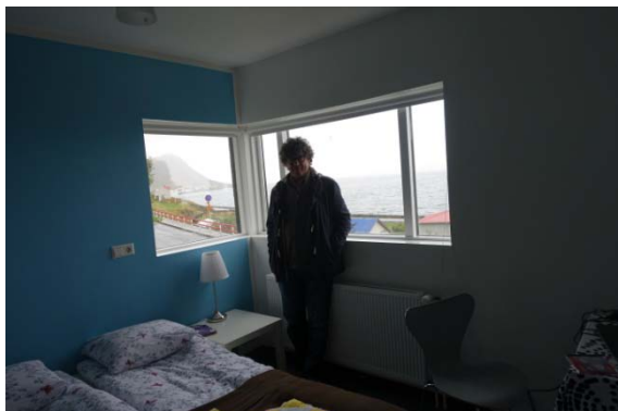
Notre chambre avec vue à Patreksfjordur