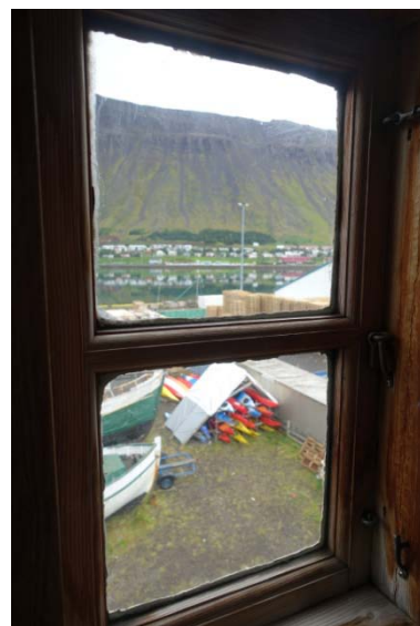
Vue de la tour