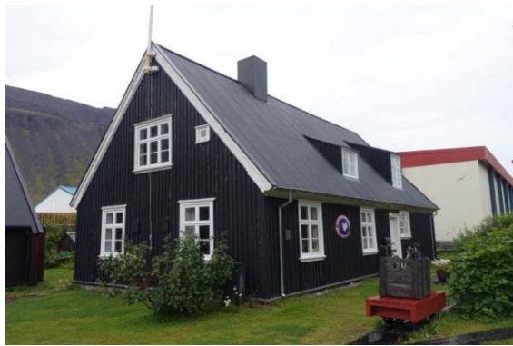
Le musée du patrimoine dans la maison à la tour.