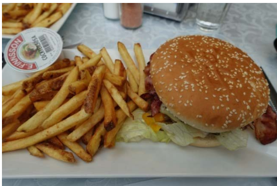
Diner dans une station service !