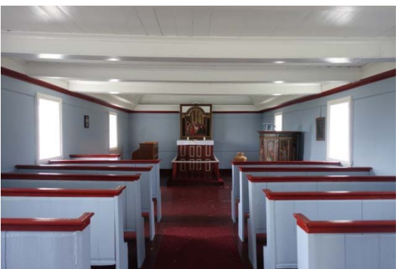
L'église de Selardalur