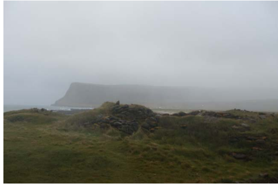
Ancienne maison de pêcheurs