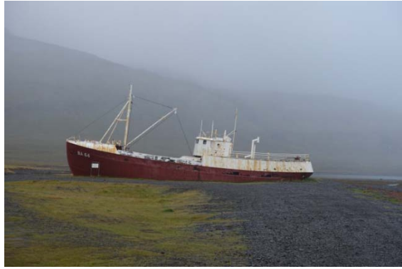
Fabriqué en 1912, le plus vieux bateau islandais en acier