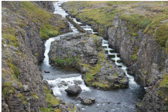
Ascenseur à poissons ?