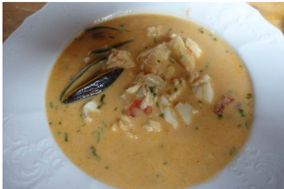
Une excellente soupe de poissons