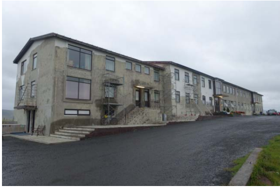
Une école transformée en hôtel