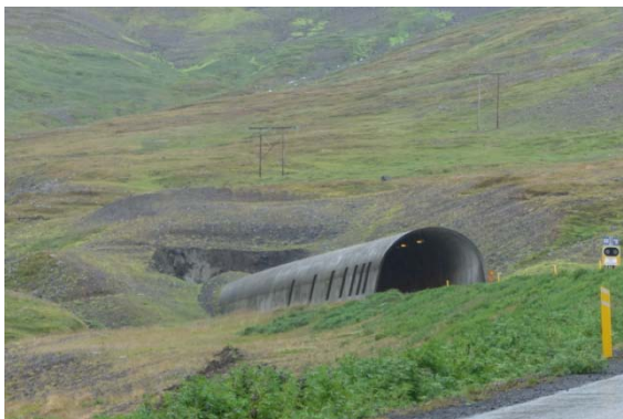
Le plus long tunnel d'Islande