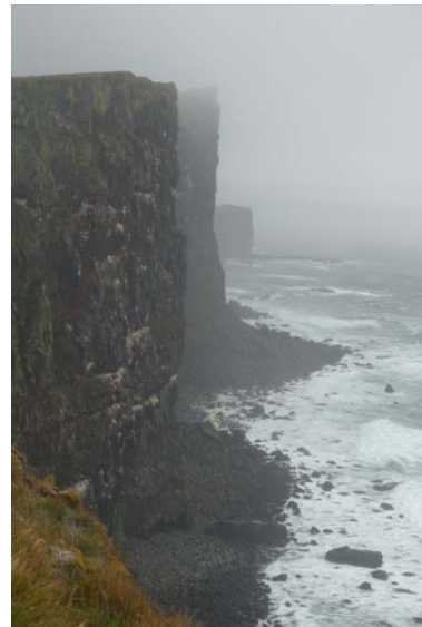
Les falaises de Latrabjarg