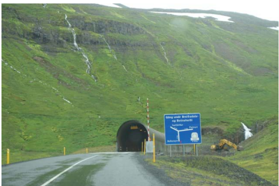
...le tunnel donc... a 3 axes !