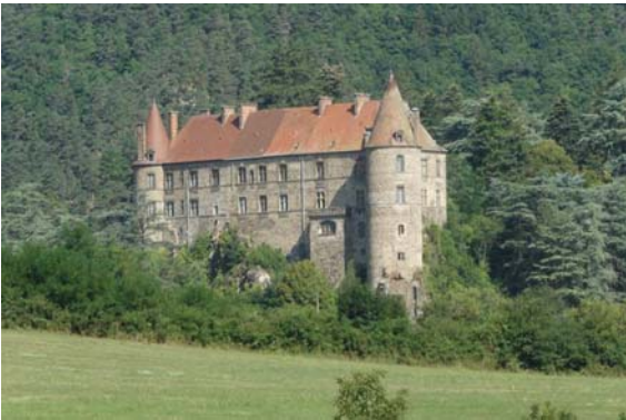
Château de la Voute Polignac