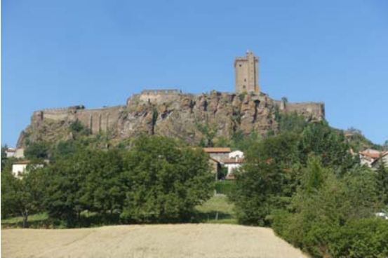
Forteresse de Polignac