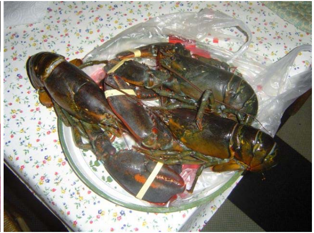
Après Noël, le lundi le homard est abordable !