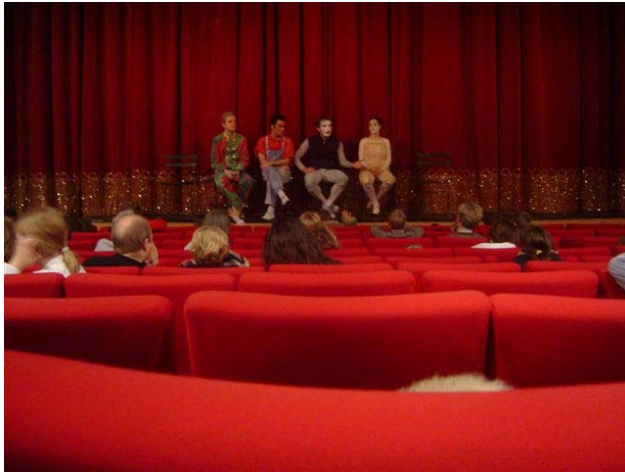
Un bon spectacle : le carnaval des animaux et Pierre et le loup par le l'Eclat théâtre.