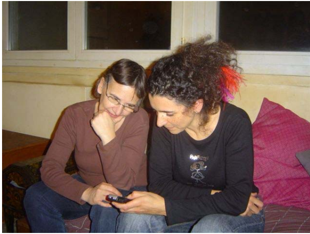
Une corse de passage à Paris !