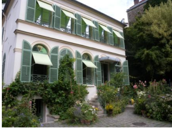
Le musée de la vie romantique