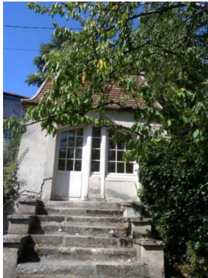
Le musée Jean-Jacques Rousseau à Montmorency