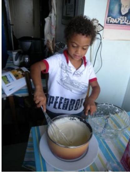
Retour de Martinique...