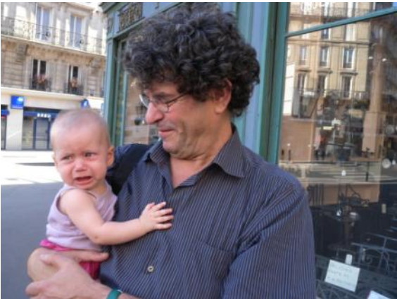
Retour du Québec