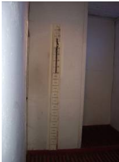
Tous les moyens pour donner la mort : des crochets, une toise percée...