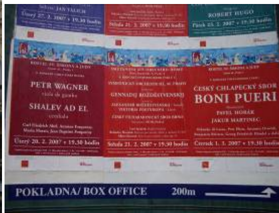
La maison municipale où se trouve la salle Smetana et l'affiche du concert où nous irons le soir.