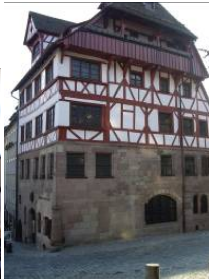
La maison d'Albrecht Dürer