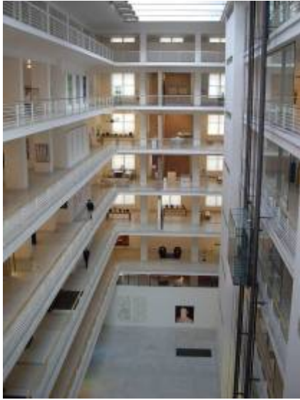
Le magnifique musée du palais Veletzní.