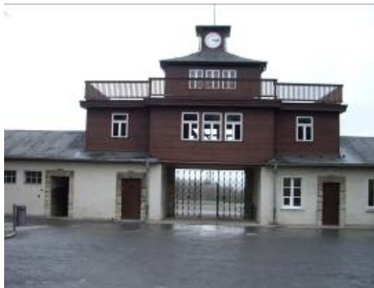
A 8 km de Weimar, l'horreur de Buchenwald...