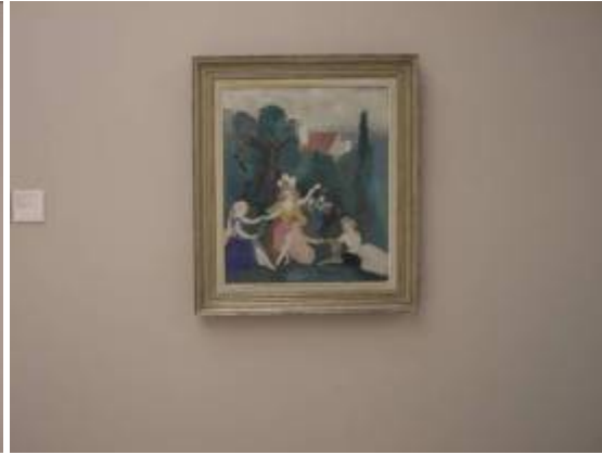
Un Marie Laurencin...