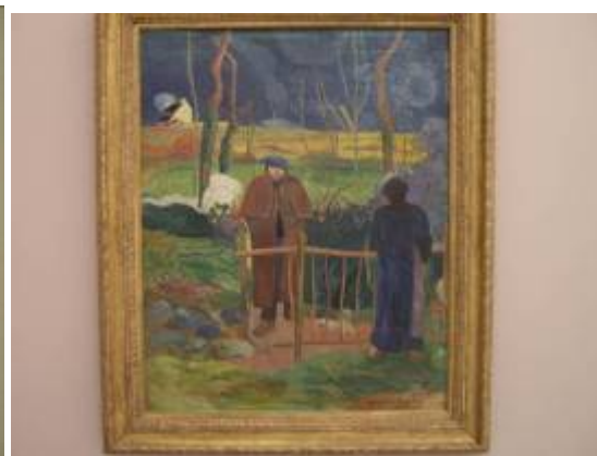
Bonjour Monsieur Gauguin