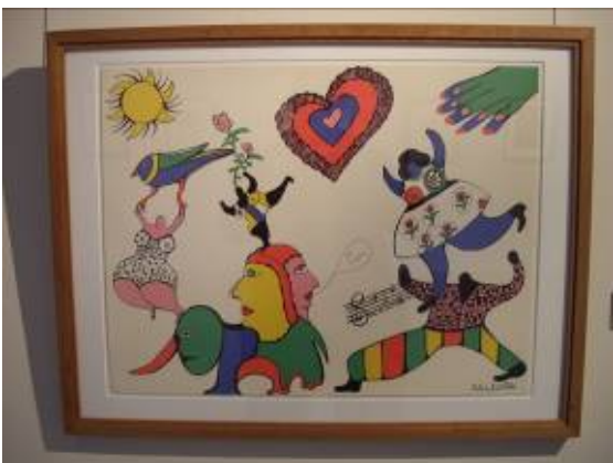
"Je t'aime" de Botero