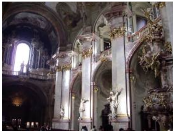
L'église Svaty Mikulase ( St Nicolas)