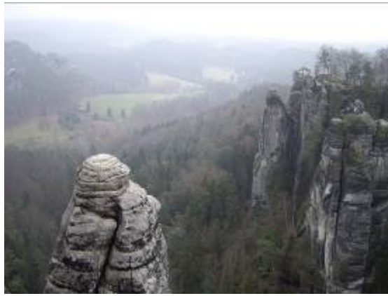
Les surprenants rochers de Bastei