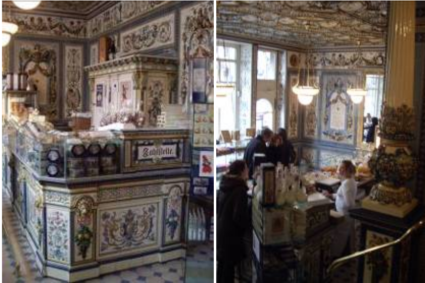
Pfunds Molkerei : la plus belle fromagerie du monde !