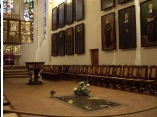
Leipzig : la Thomas Kirche, l'église de Bach... et sa tombe.