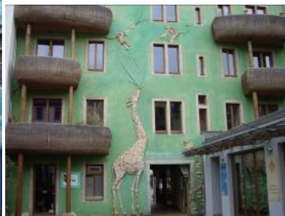
Les passages dans la ville nouvelle de l'autre coté de l'Elbe.