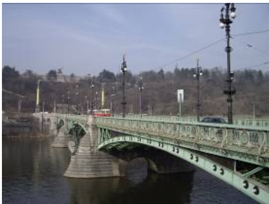
Un pont style Napoleon III. En haut, il y a bien longtemps été installée une monumentale statue de Staline