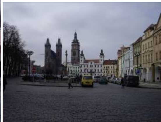
A 150 km de Prague, la petite ville de Hradec Kralove