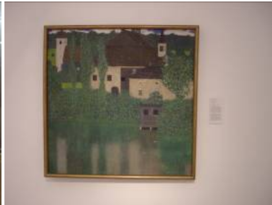
Un tableau de Mucha