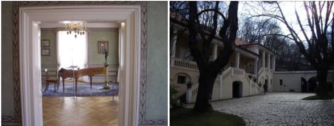
La Villa Bertramka : la maison de Dusek où vécut Mozart