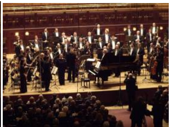
Un magnifique concert dans la salle Smetana par la famille Rojdestvenski, Guennadi, Sacha et Victoria Postnikova interprétant des œuvres de Janacek, Martinu et Roussel.