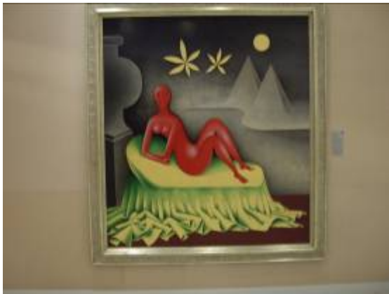
Cléopâtre de Zravy