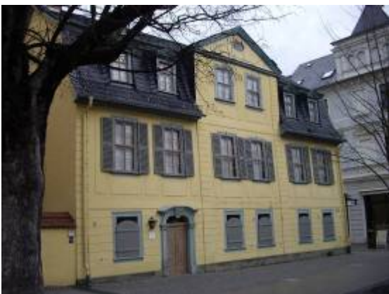
Weimar : la maison de Schiller.