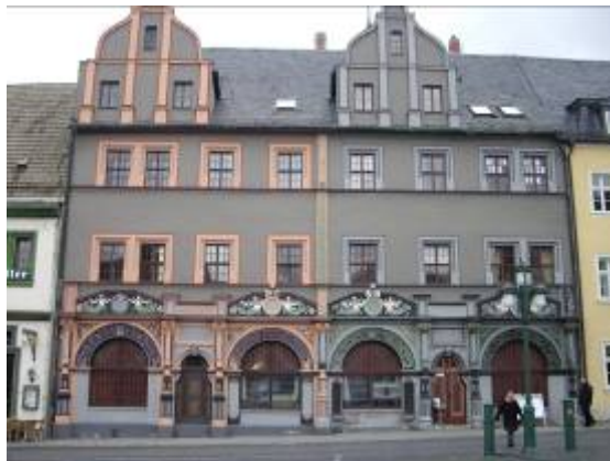
La maison où a vécu et est mort Cranach