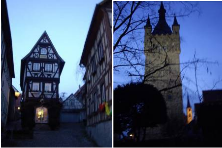
Une première étape dans une belle petite ville : Bad Wimpfen