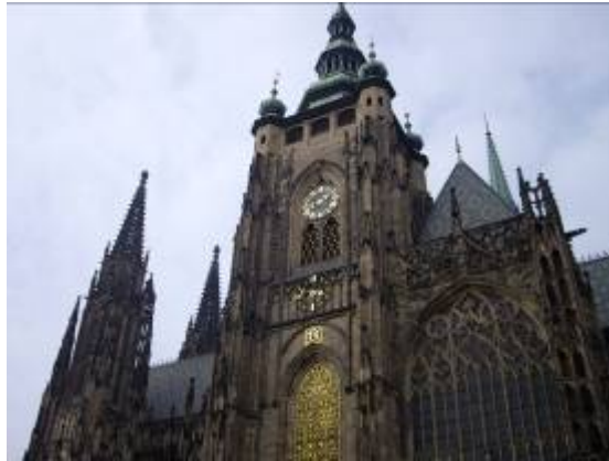
Un vitrail de Mucha dans la cathédrale Svaty Vit ( St Guy)