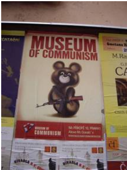
A noter que le musée est à coté du Mac Do !