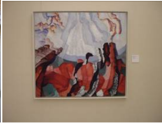
La création par Kupka.