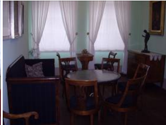
La sympathique maison de Mendelssohn.