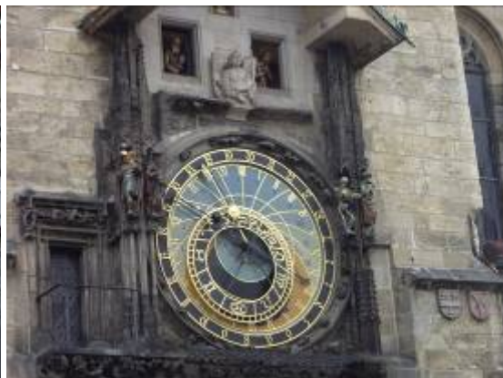
Voici Prague : du haut de la tour de l'horloge de la place Staromestke