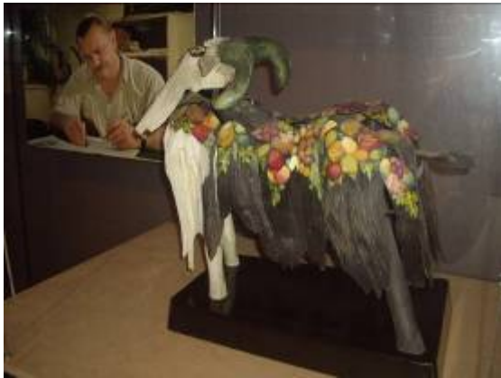
Le célèbre marionnettiste Jyri Trnka