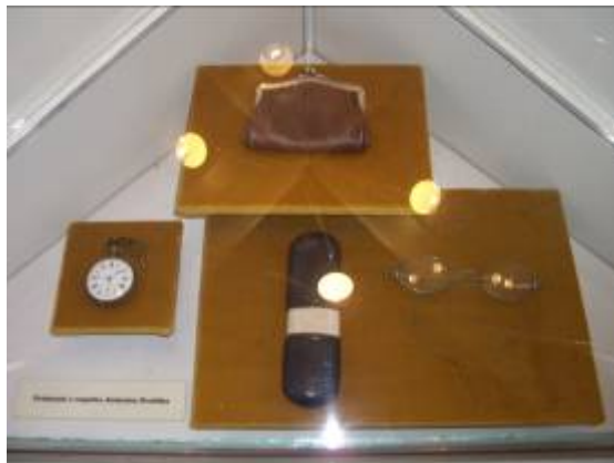
Son piano, ses lunettes, sa montre, son porte-monnaie...