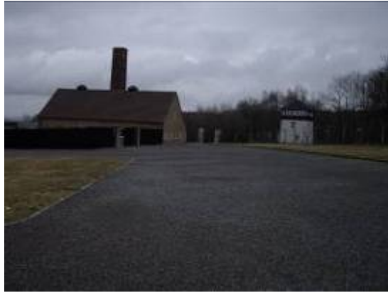
L'entrée du camp : "A chacun son du" et le four crématoire...