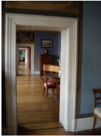
Celle de Goethe