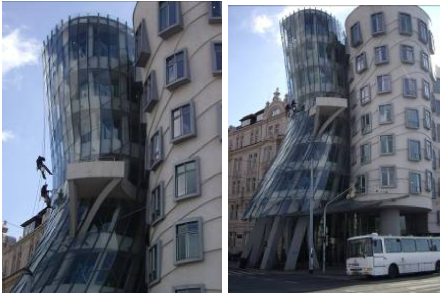
La maison dansante et les laveurs de vitres...