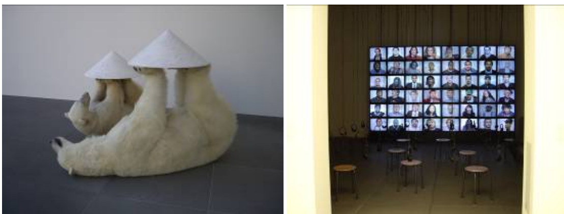
Nuremberg : le Neues museum, musée d 'art et de design