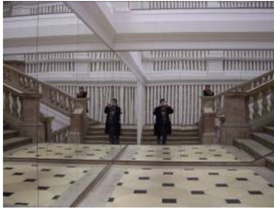
Le Neues Museum et son escalier de glaces... C'est une idée de Buren !