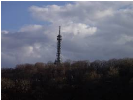
Il y a aussi une petite tour Eiffel !