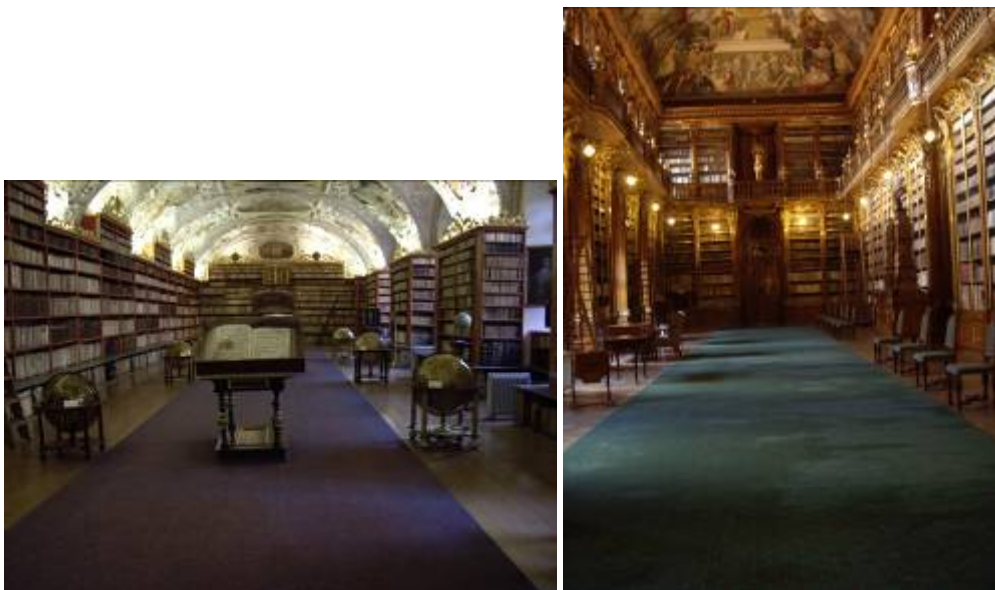
Les magnifiques bibliothèques du cloître Strahovsky