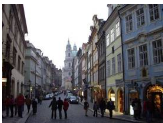
Le couvent de Loretta