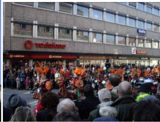
Un carnaval publicitaire pour des vêtements dans le centre de Nuremberg, il y a même en dessous une pancarte pour Angela Merkel sur la photo du dessous.