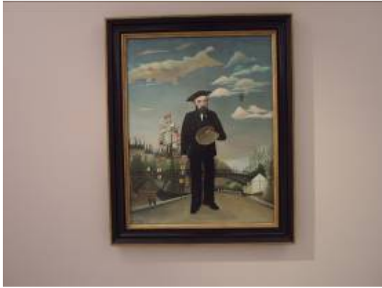
Autoportrait du Douanier Rousseau