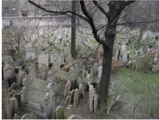
Josefov, le quartier Juif : synagogues et cimetière