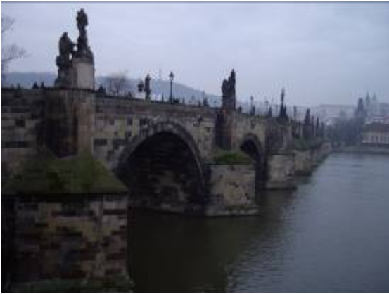
Le pont Karlův ( Charles) sur la Vltava ( la Moldau).