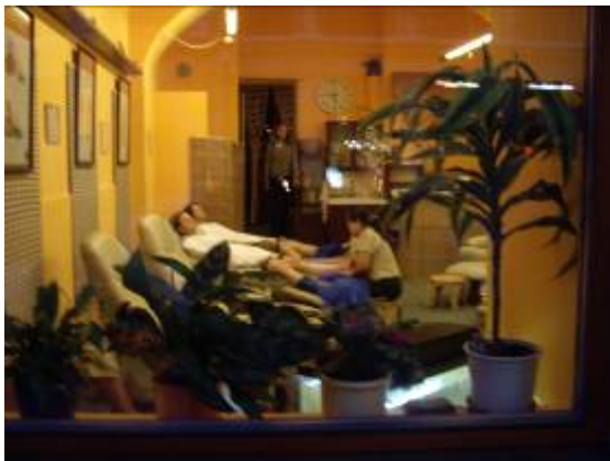
Après de longues marches, un massage de pieds en public !