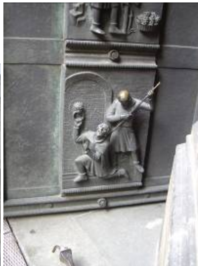
L'entrée du Château... et de la cathédrale.