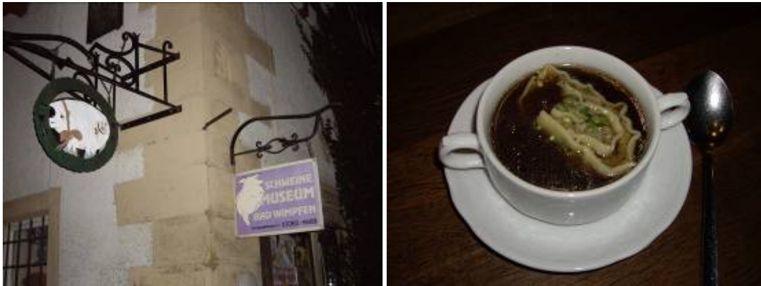
Au pays du cochon et des bonnes soupes, ici avec un ravioli assez spécial !