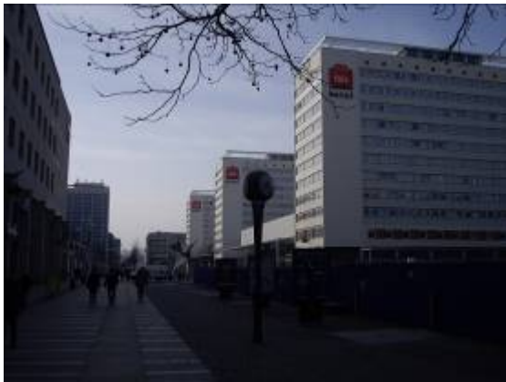
Une rue d'hôtel Ibis et à gauche, c'est un hôtel Mercure !