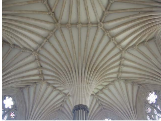
La salle capitulaire