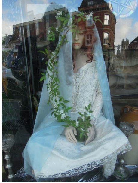
Glastonbury, berceau du christianisme en Angleterre et ville ésotérique