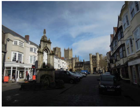
Wells : Market place