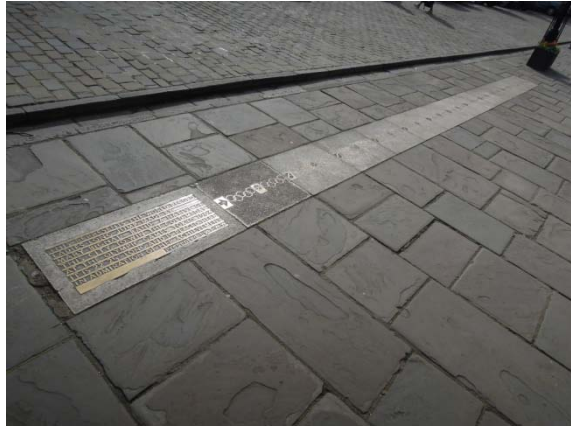
Le saut olympique de Mary Rand en 1964