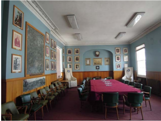
La salle du conseil municipal