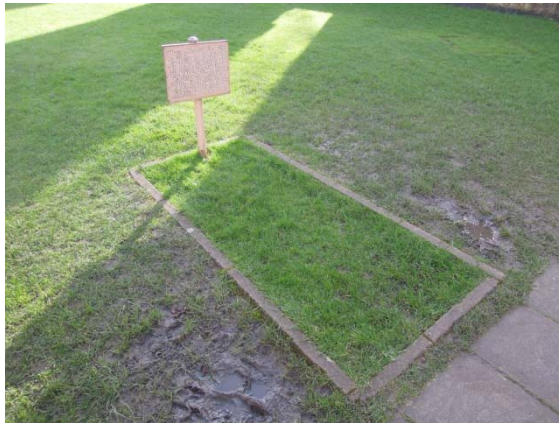
L'emplacement où ont été découverts Arthur, Guenièvre et le Saint-Graal et là où ils ont été enterrés.