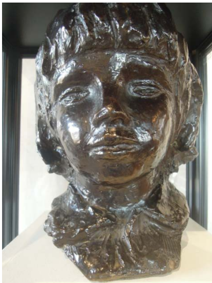
Renoir : buste de Claude