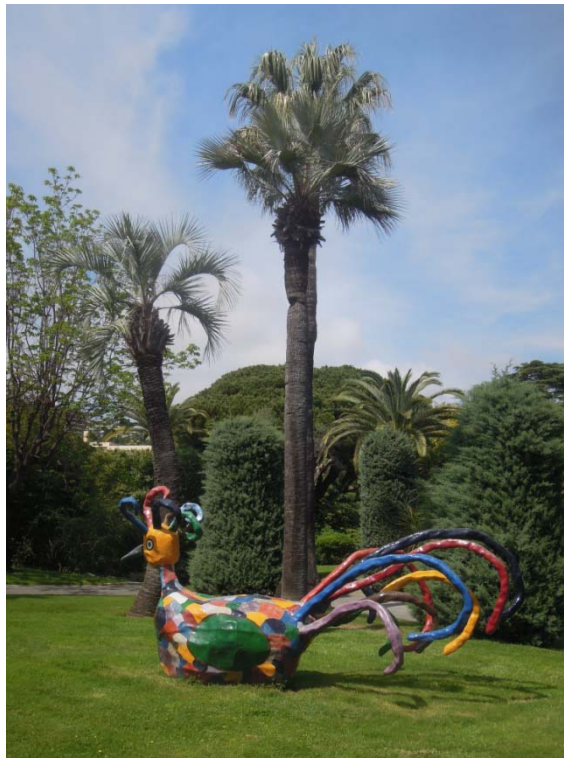
Musée d'art naïf Jarovsky : Frédéric Lanovsky