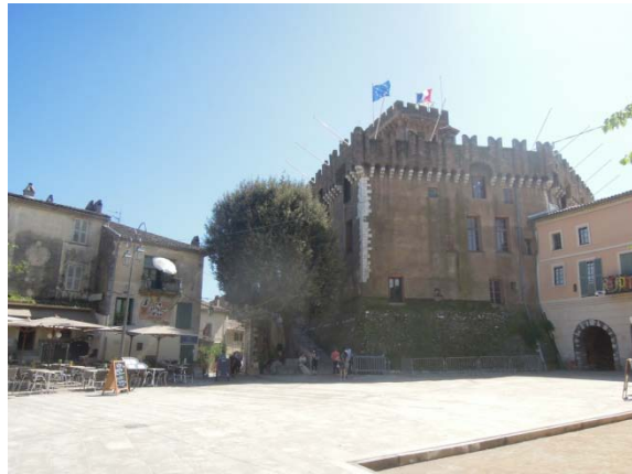
Château des Grimaldi, les hauts de Cagnes