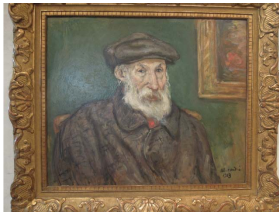
Renoir par Albert André