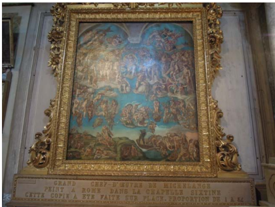
Reproduction de la chapelle sixtine