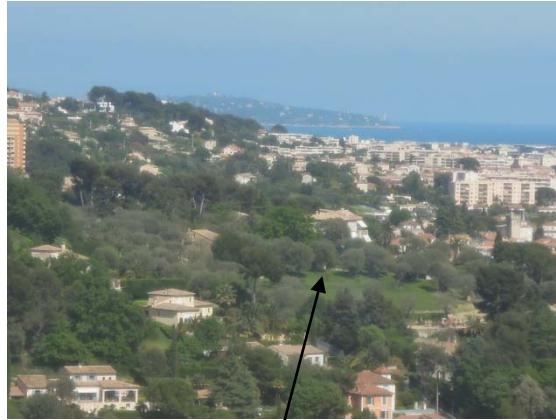
Au centre, la maison des Colettes et à gauche la ferme