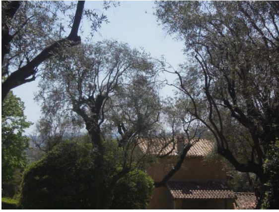
Le dos de la Maison des Colettes de Renoir (fermé)