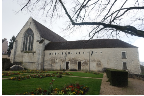
Châteauroux : couvent des cordeliers