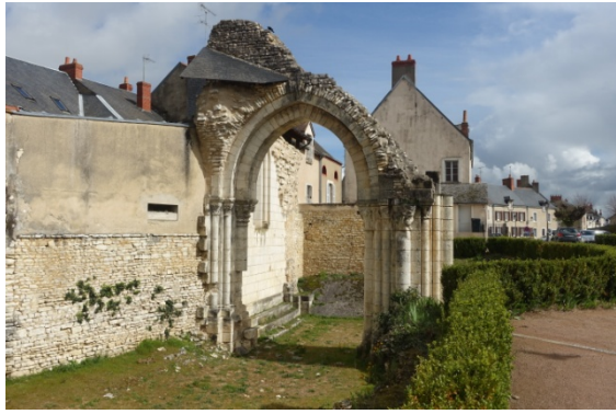
Abbaye Notre Dame de Deols