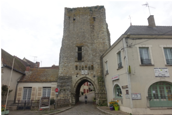
Mennetou sur Cher