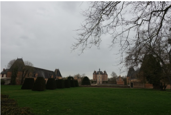
Château de la Ferté Imbault