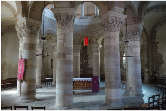
Neuvy St Sépulcre