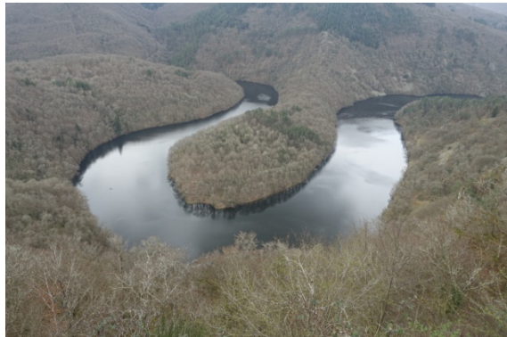
Le méandre de Queuille