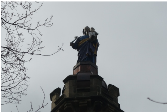
Chapelle St Joseph