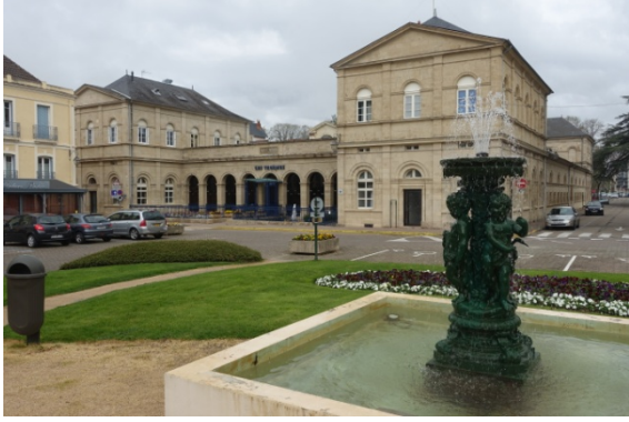
Neris les bains