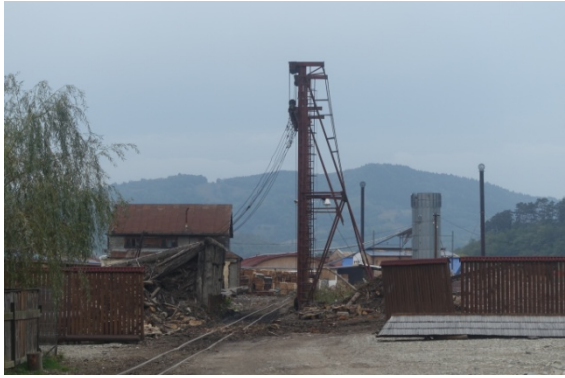
La Mocanita, le train des bucherons circulant dans la vallée de la Vaser