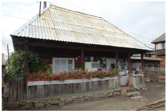
Les casseroles symbolisent la richesse de la fille à marier