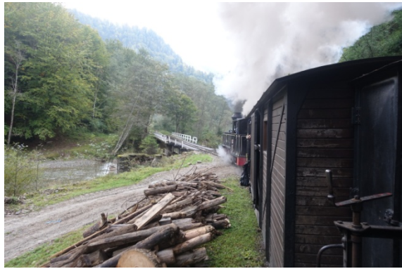
Voiture sur rail pour les ouvriers