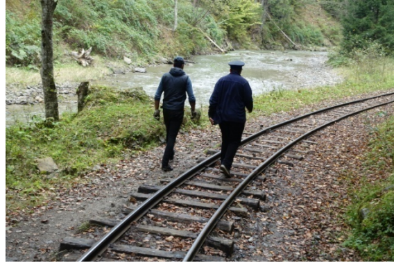
Quelque chose a été perdue...