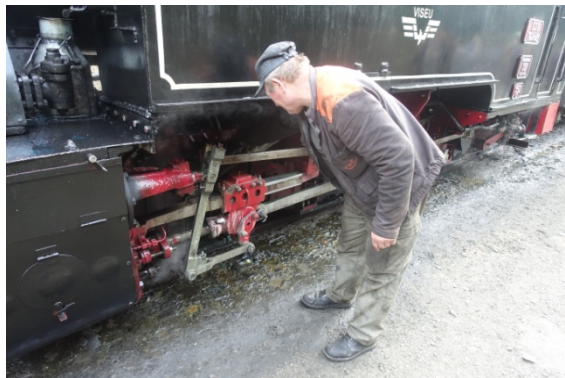
Arrêt eau et graissage