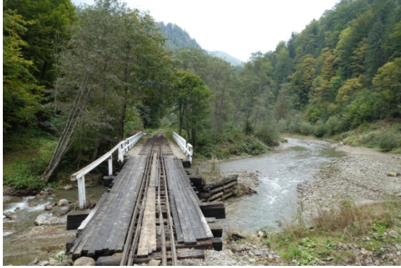
Le bloc voie