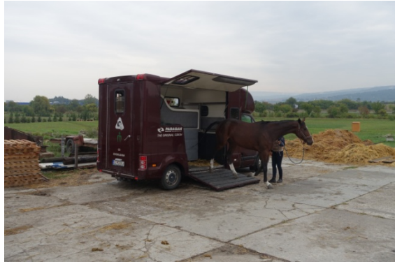
Le haras à coté de notre hôtel