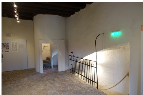
Musée de l'ancien Hôtel de Ville