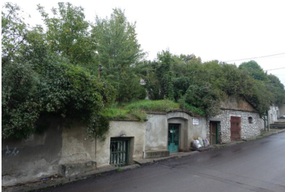
Les caves à vin