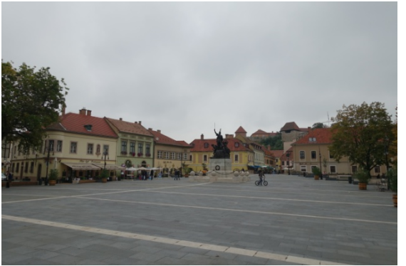
La plaie Dobo et la Minorita templon