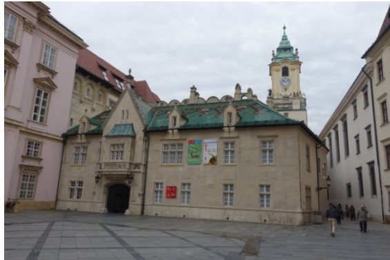
L'ancien Hôtel de Ville