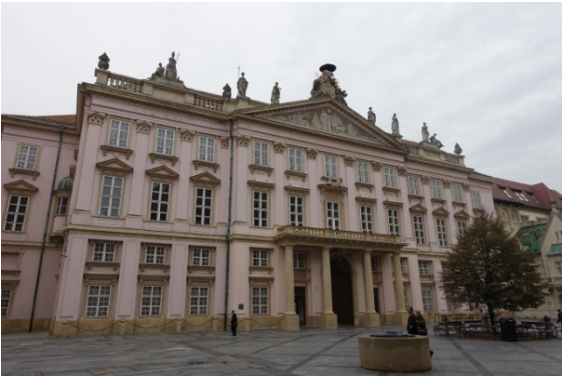
Le palais primatial