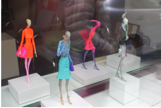
Devant la maison de Hummel