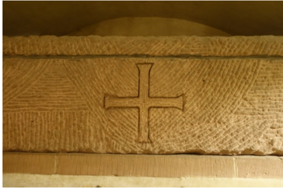
Pendant 300 ans, lieu de sépulture des rois et empereurs d'Allemagne