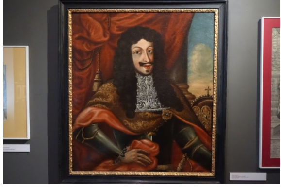
Musée du Palais Mirbach