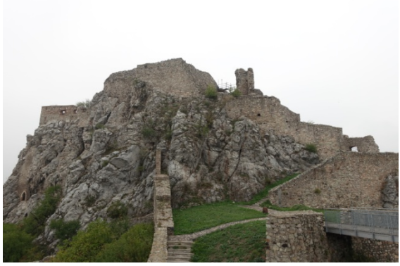
Slovaquie, le château de Devin près de Bratislava