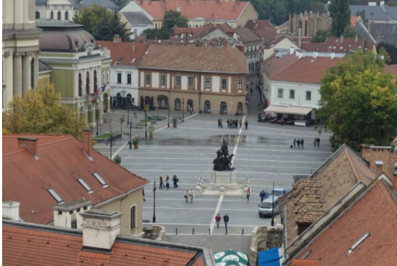
La place Dobo