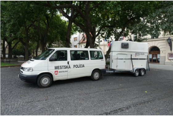
Police à cheval ?