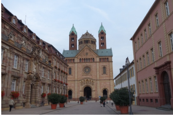
Allemagne : Speyer, la plus grande cathédrale romane d'Europe