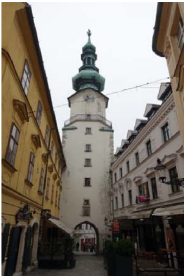
La porte St-Michel