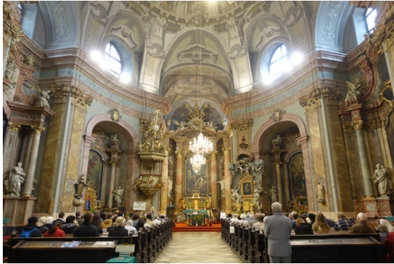
Eglise des Trinitaires avec son dôme en trompe l'œil