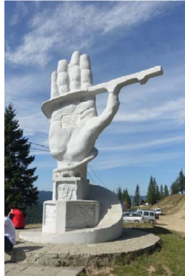
Aux constructeurs de la route ouverte en 1968