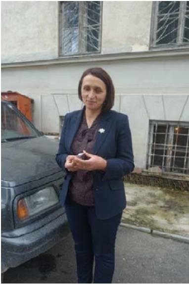
La directrice du musée