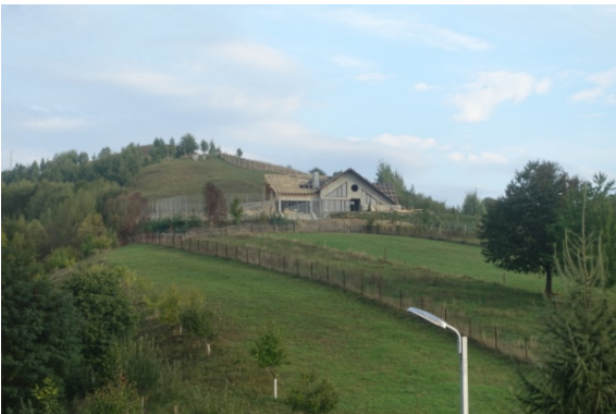
Vue de notre chambre d'hôtel à Gura Humorului