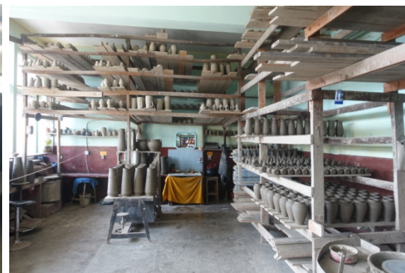
Céramiques de Marginea