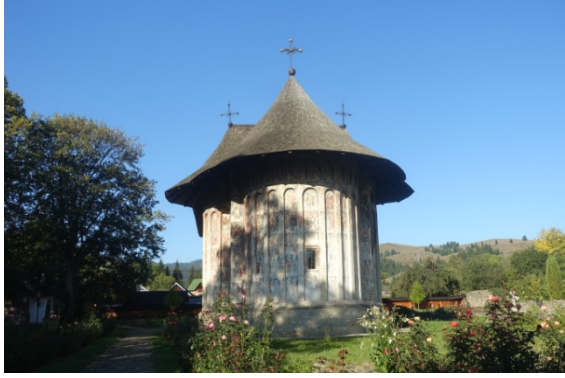
Humor le vieux