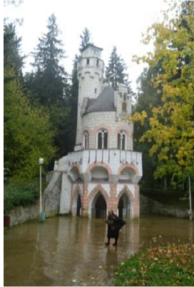
Casino et source thermale