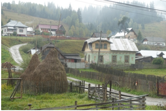
La maison de la police