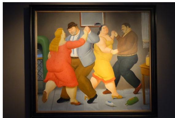
Galerie Hopkins, Botero