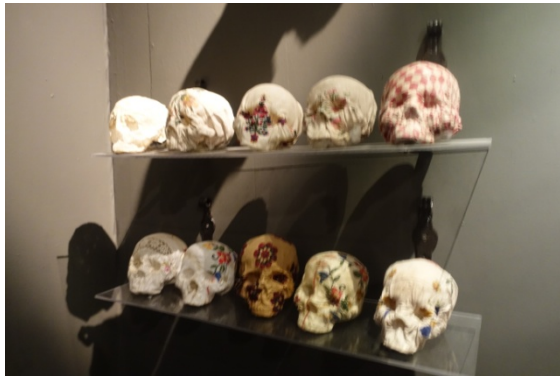
Halle St Pierre, Hey Modern art & pop culture – act III