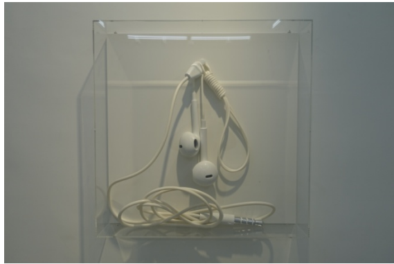
Galerie Rabouan Moussion