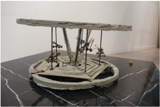
Galerie Virginie Louvet, Boris Chouvellon