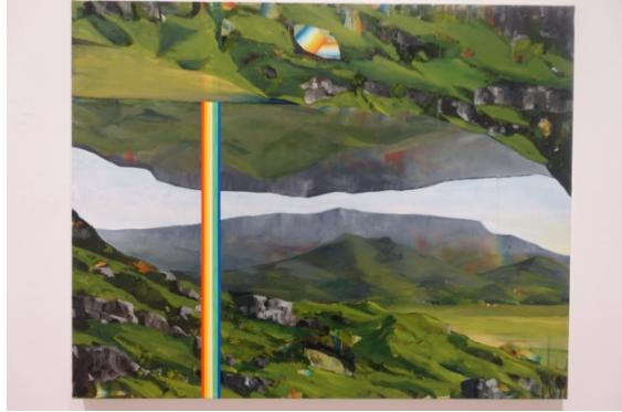
Galerie Zurcher, David Lefebvre