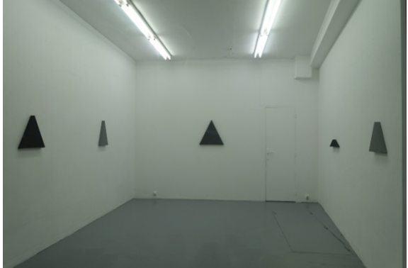
Galerie Jean Brolly, Alan Charlton