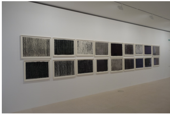
Galerie Gagosian : Richard Serra