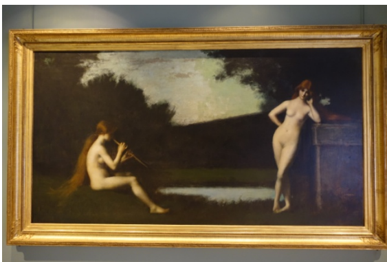
Petit Palais : Jacques Henner, églogue