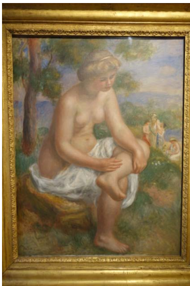
Renoir : baigneuse dite d'Eurydice