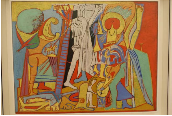
La crucifixion – 1930