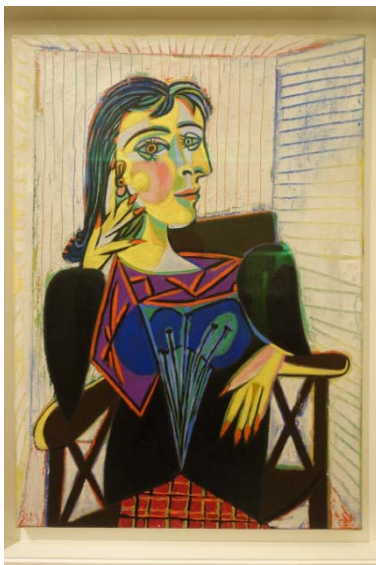
Dora Maar – 1937