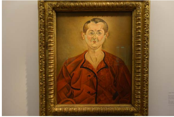
Miro : autoportrait 1931