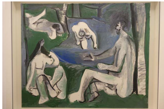
Le déjeuner sur l'herbe – 1961