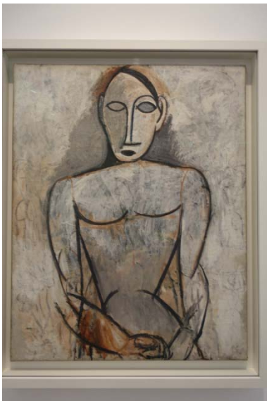
Etudes pour les Demoiselles d'Avignon