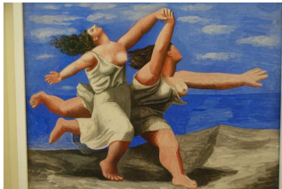
2 femmes courant sur la plage – 1922