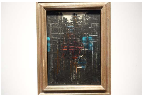
Ernst : l'oiseau forestier