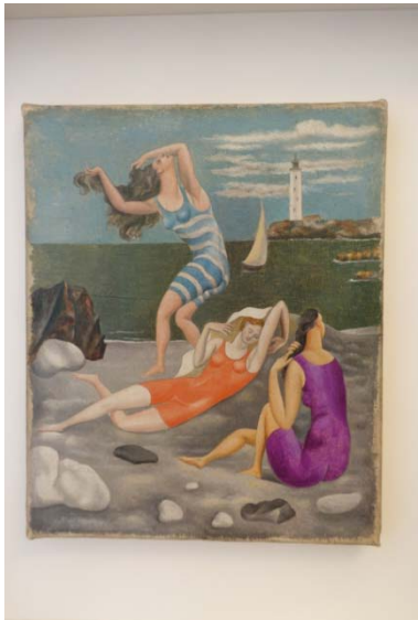
Les baigneuses – 1918