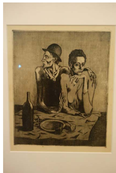
Le repas frugal