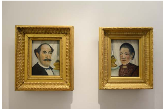
Le douanier Rousseau