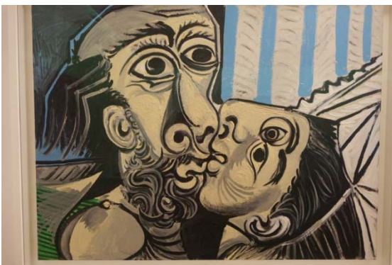
Le baiser – 1969