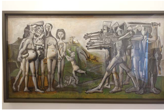
Massacre en Corée – 1951