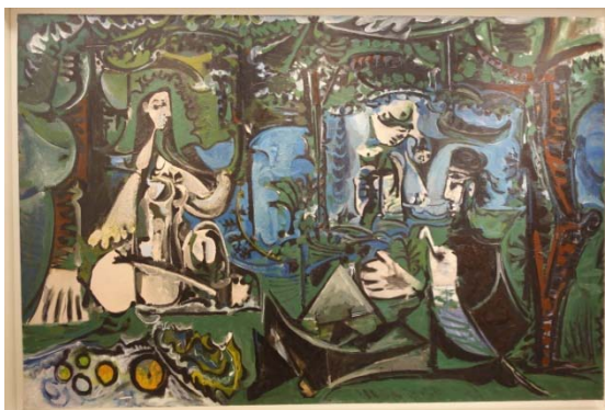
Le déjeuner sur l'herbe – 1960