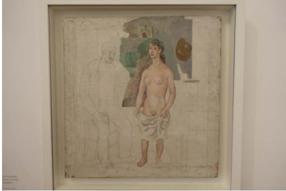
Le peintre et son modèle – 1914