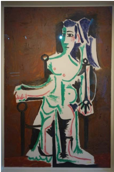
Femme assise – 1963