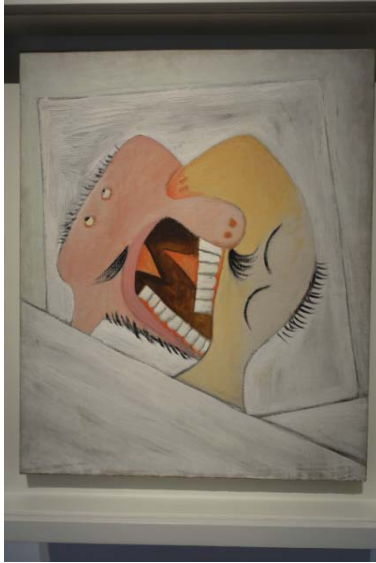
Le baiser – 1931