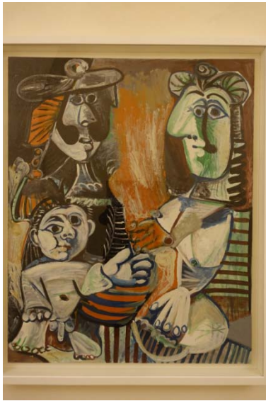
La famille – 1970