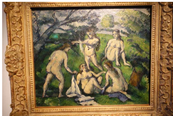
Cézanne : les 5 baigneuses