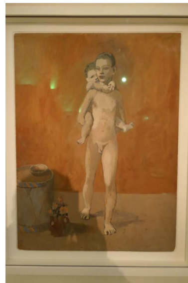
Les 3 frères – 1906