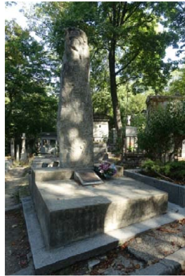
et celle d'Asturias