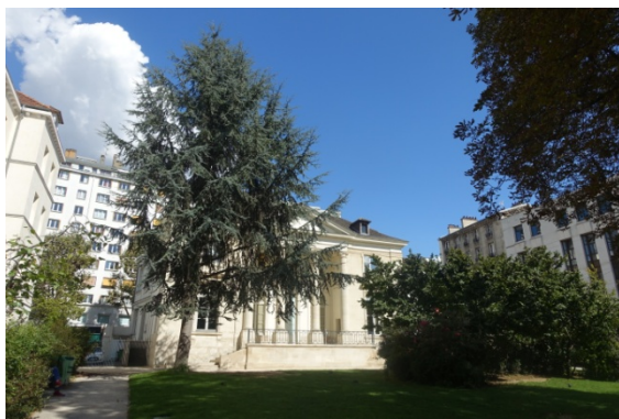
Carré de Baudouin