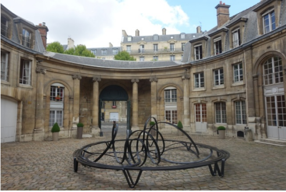
Bd St Germain