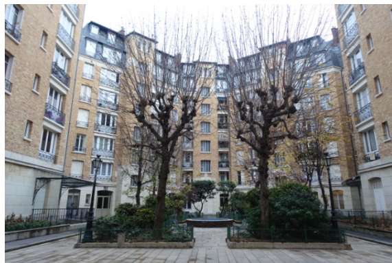
Rue de Prague