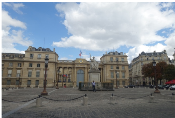
Place du Palais Bourbon