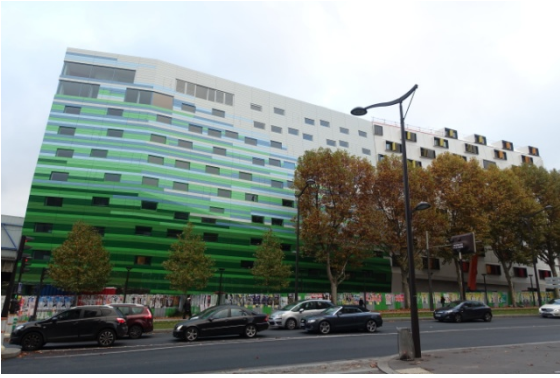
Bd Sérurier, futur rectorat