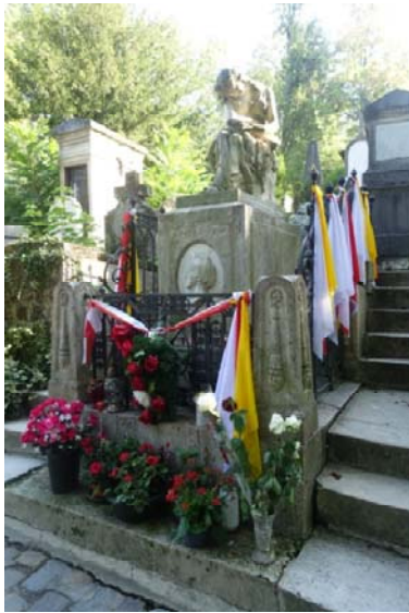
Père Lachaise, tombe de Chopin