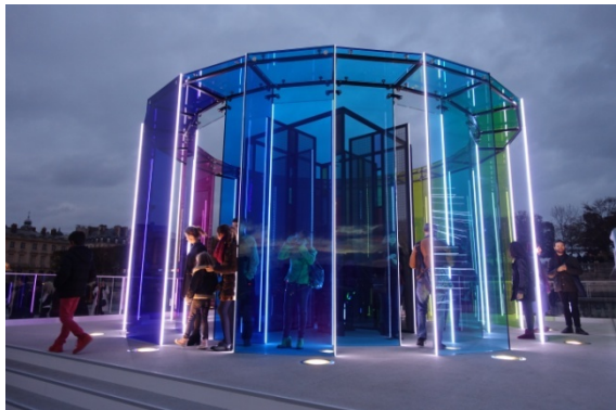
St-Gobain, 350 ème anniversaire