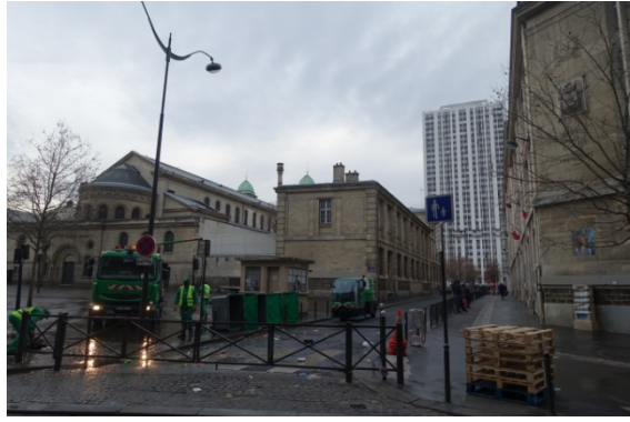
Marché de Joinville