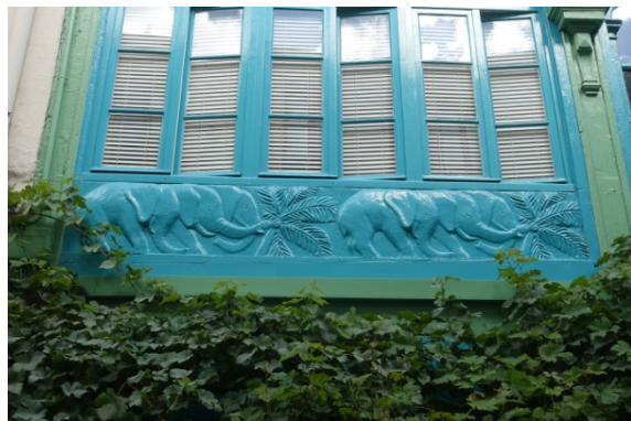
Cité du figuier