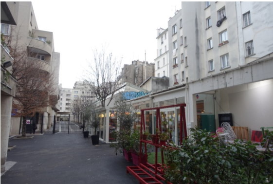
Le 108 av de Flandre