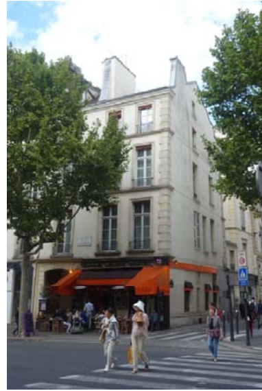
Maison de Guillaume Apollinaire