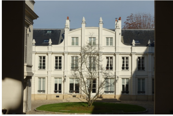
rue de Grenelle