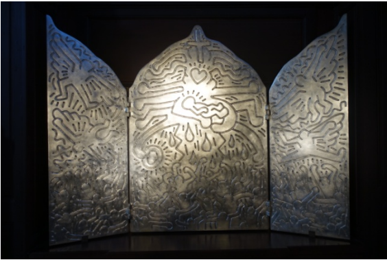
Triptyque de Keith Haring à St-Eustache