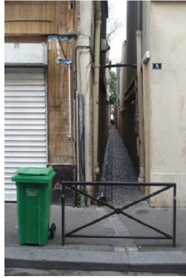
Passage du Plateau