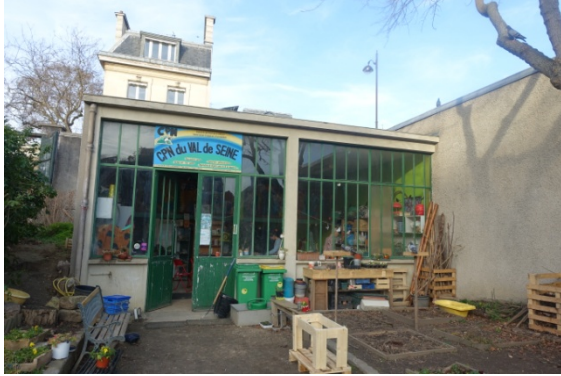
Jardin Catherine Labouré