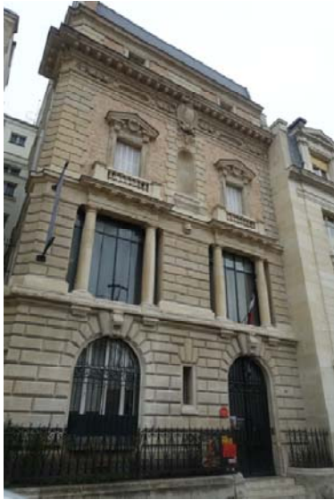
Musée Gustave Moreau