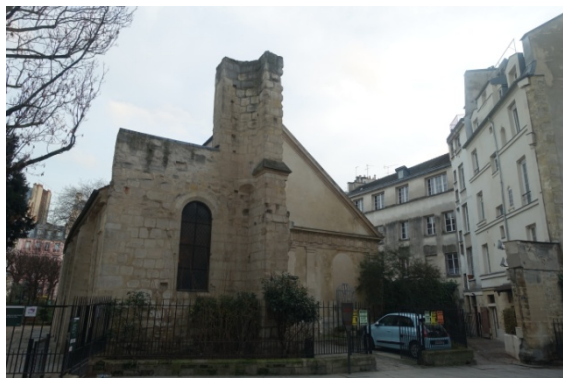
Eglise St Julien le Pauvre