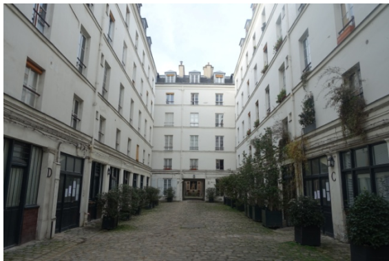
Hôtel de Montmorency