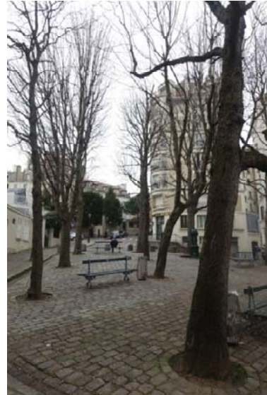
Emplacement du Bateau lavoir