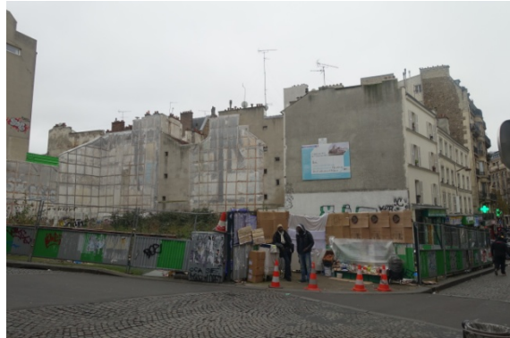
France terre d'Asile