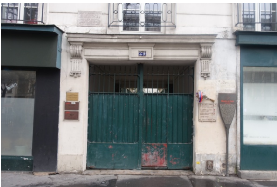
La maison de Méliès