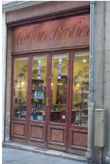
Rue St Claude