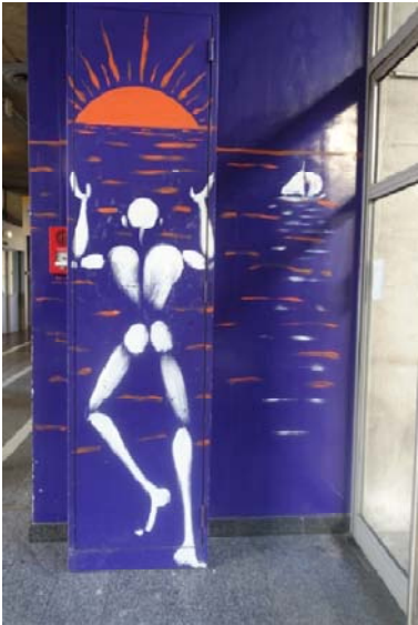
Hôpital St Antoine