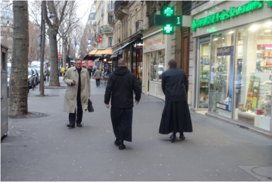
A trottinette bd St Germain