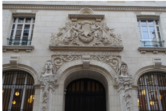
Hotel de Choiseul Praslin