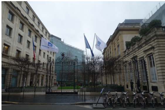
Av Matignon AXA