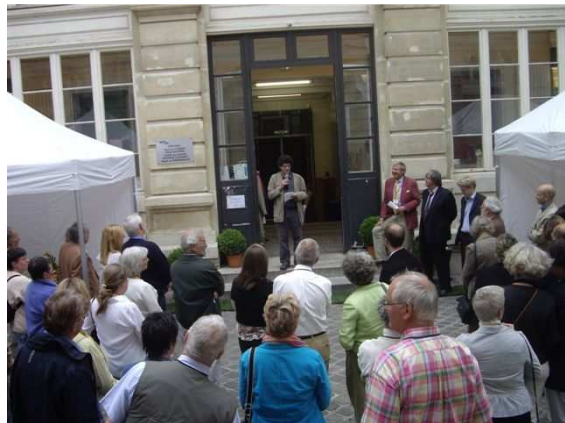
Accueil en Mairie de l'association Barges de péniches françaises, anglaises, hollandaises... J'ai fait le discours de bienvenue en anglais !