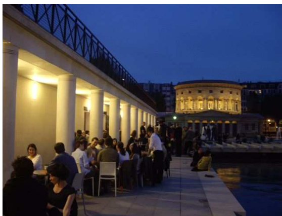
Un nouveau lieu : Mabrouck Mezouane a ouvert vendredi son café 25° à l'Est dans le local triangulaire de la place de Stalingrad.