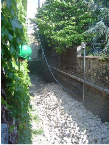
la cour anglaise a été dépavée