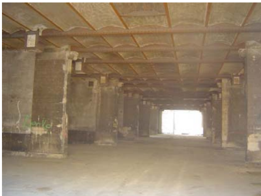
au sous-sol, l'espace salon dans les anciennes écuries sera bientôt plus lumineux !