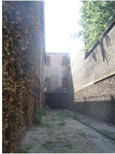
l'autre cour anglaise...