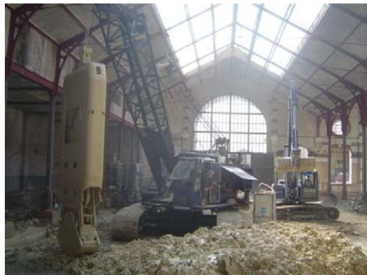
on est dans l'espace entre les 2 salles de diffusion