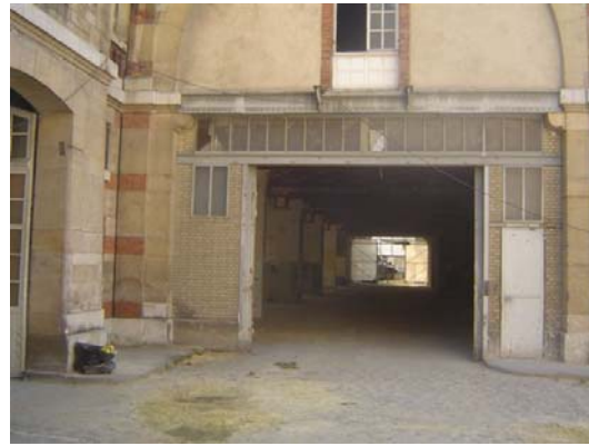
l'axe du restaurant-café...