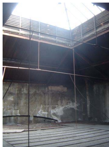
le futur espace de proximité : le rez-de-chaussée et le 1 er étage