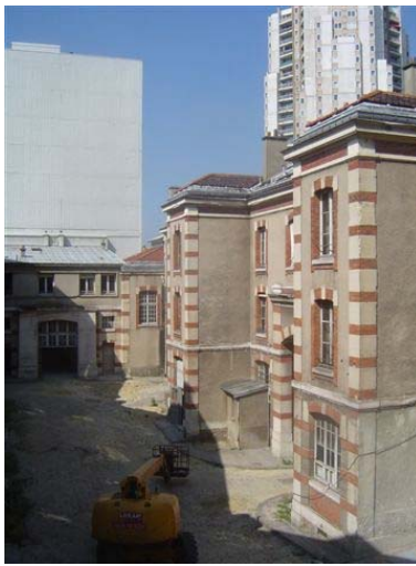
la cour de l'entrée Curial