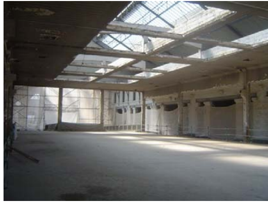
la placette de part et d'autre des commerces et du restaurant café