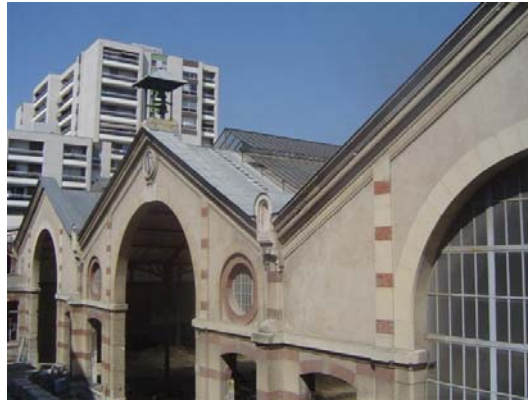
la cour de l'horloge