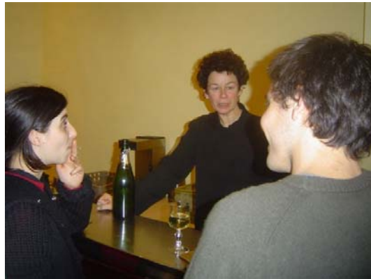
Peut-être qu'il sera programmé l'année prochaine !