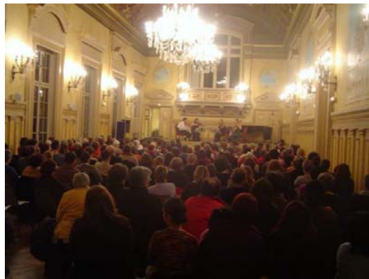
Pas mal cette photo pour une pochette de disque...