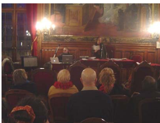
la salle des mariages pour des jeux de et sur les mots, un lieu insolite...