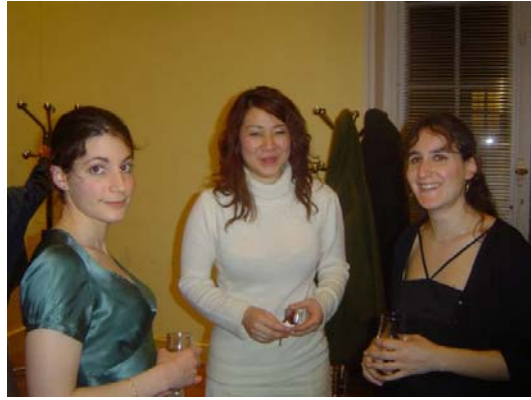
Une très bonne soirée en forme de Schubertiade...