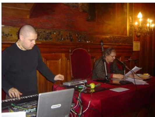
les compères : préparatifs...